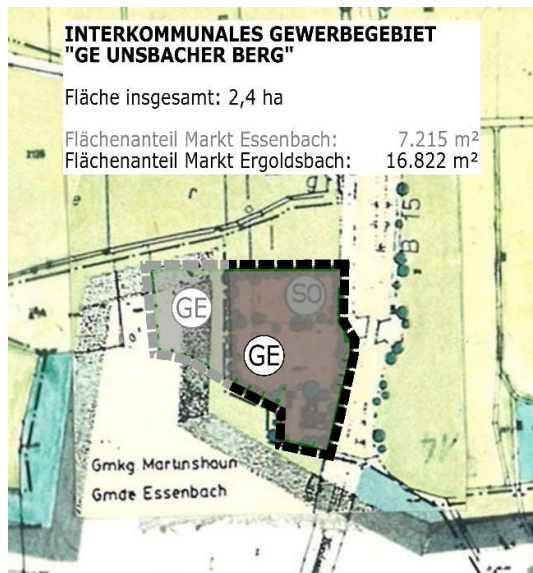
Planung im Änderungsbereich des Flächennutzungsplanes Markt Ergoldsbach

Das Plangebiet beinhaltet die Grundstücke mit den Flurnummern 356/3, 357/2, 3568/1 und 3568/2, alle Gemarkung Martinshau.