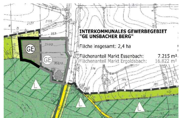
Planung im Änderungsbereich des Landschaftsplanes Markt Essenbach