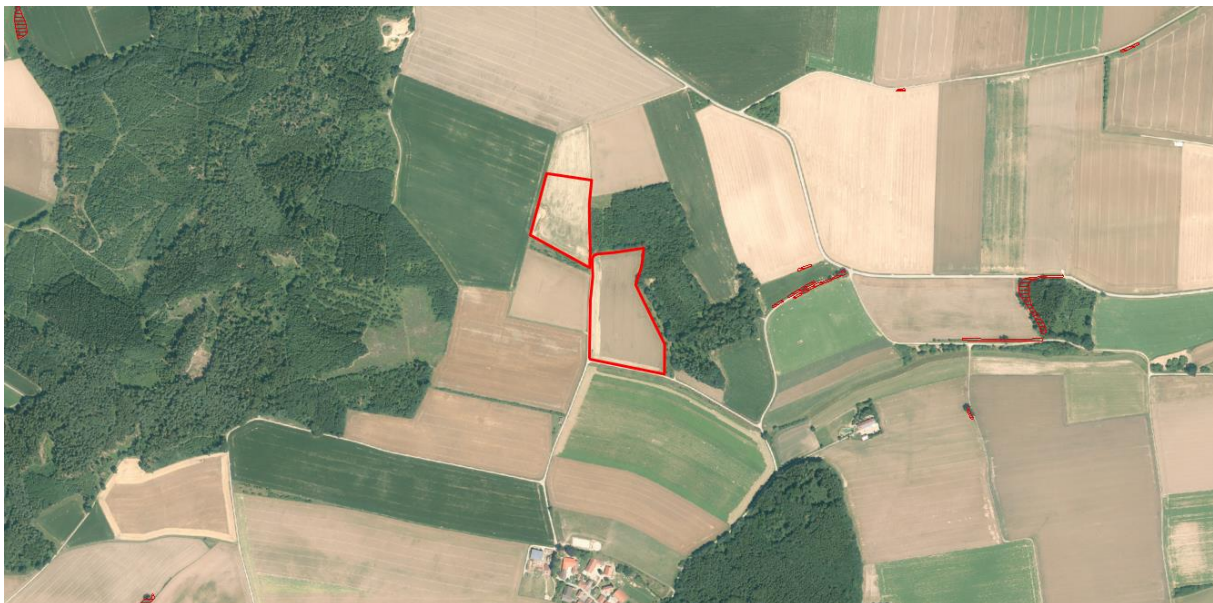
Abbildung 1 : Auszug aus Biotopkartierung

Es werden keine Flächen nach ABSP oder Biotopkartierung überplant. Kartierte Biotope befinden sich in mindestens 260 m und stehen nicht in funktionellem Zusammenhang mit den überplanten Flächen.