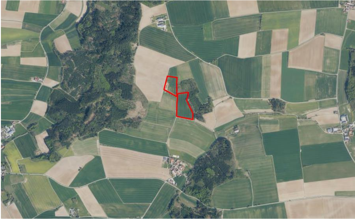
Landschaftsbild - rot: Geltungsbereich des Bebauungsplanes

Das Plangebiet bietet sich durch die eingefasste direkte Lage am Waldrand und damit bereits stark begrenzte Fernwirkung für eine Landschaftsbildschonende Nutzung mit Photovoltaik an. Durch die Lage am Waldrand ist eine gute Einbindung der Anlage in die Landschaft möglich. Der Wald gibt einen natürlichen Rahmen vor, wodurch die Anlage als weniger störend empfunden wird.