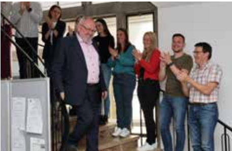
Bürgermeister Ludwig Robold auf seinem Abschiedsgang durch das Rathaus