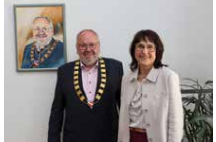
Bürgermeister Ludwig Robold bei der Übergabe der Amtskette an seine Nachfolgerin Heike Berger