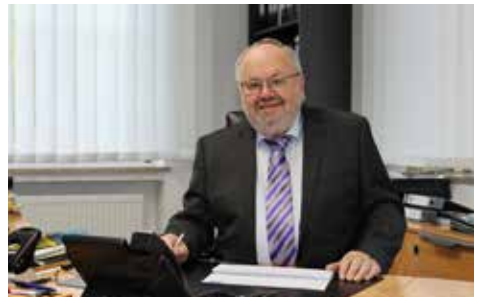
Bürgermeister Ludwig Robold an „seinem“ Arbeitsplatz im Rathaus